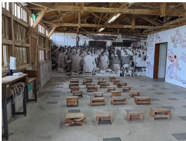
▼政治課是思想改造的手段之一，政治受難者在悶熱的教室空間，坐在自己手做的椅凳上聽課。