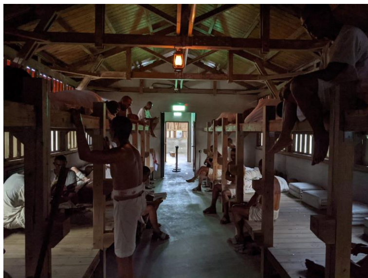
▼第三大隊營舍寢室區以等比例模型，重現政治受難者在一天勞苦的勞動後，就寢前的時光。

由於當地海風侵蝕且多颱風，建物保存不易，但為了讓參訪者了解當時環境和氛圍，園區仰賴當年關押在此的受難者以口述、手繪、照片、手稿等方式，原樣重建第三大隊營舍，內含獄方人員與政治受難者的寢室、政治課的教室空間等，並復原福利社、克難房和廚房等歷史現場。在展區中，以蠟像模型重現「寢室區」。僅有一個入口，而沒有出口的「寢室」，前段為官兵幹部房間，隔著鐵柵門；中段為新生睡覺通鋪，通常住了 120~150 位政治受難者，可想像當時擁擠的程度；後段為盥洗間及廁所，盥洗間有用水泥砌成的儲水槽和盥洗臺。曾經有一段時期，新生人數太多，晚上在盥洗間儲水槽上架著木板，或吊掛茅桿編的吊床，睡在盥洗間及廁所內。